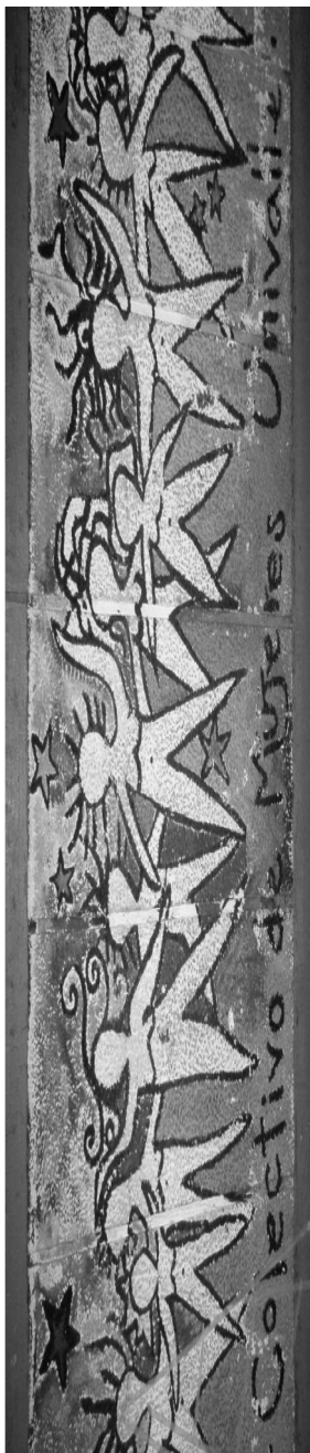
Mural del Colectivo de Mujeres Univalle (Universidad del Valle, Cali, Colombia) amb motiu d'una marxa del 8 de març

LA GENERALITAT, L'AJUNTAMENT I LA DIPUTACIÓ ES COMPROMETEN A FINANÇAR LES OBRES DE RIPO LL, 25