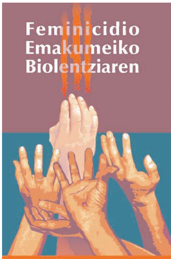
Jornadas de Mugarik Gabe Nafarroa y Aldea en 2006.

En muchos países del mundo la tradición es un pretexto para seguir sometiendo a las mujeres. Las prácticas tradicionales dañinas chocan frontalmente con el pleno desarrollo de los derechos de las mujeres que en nombre de religiones y costumbres las someten a situaciones extremas. Llevan en muchos casos a la muerte y en otros a una anulación en vida, abarcando todo el ciclo vital femenino, desde la infancia, la adolescencia, el matrimonio, las relaciones, su sexualidad, la viudez y la ancianidad.