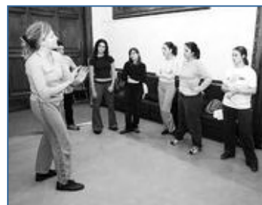
+ Algunes sòcies de Ca la Dona, en un curs de defensa personal, la setmana passada.