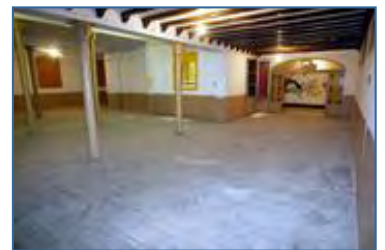
+ (Ve de la plana 2)