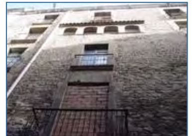
+ A dalt, l'edifici del carrer Vigatans. A sota, una de les sales de l'antiga Penya Cultural Barcelonesa.