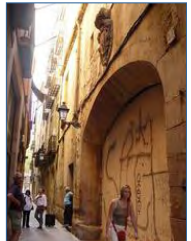
+ La façana de la Seca (esquerra). Les arcades de l'aqüeducte romà a Ripoll, 25, i les obres de la Casa dels Entremesos, i una imatge virtual del futur Palau Mercaders (de dalt a baix).